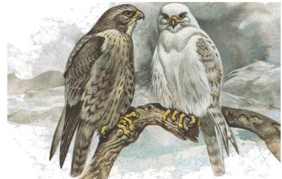
Gyrfalco flaweza lolenteon bilisa loote tid rive koton batakafa ; tela bejamusa drume aala tid loeke orikafa. Wal bat tolony lugava ord, lukoptafa inda soe kruidled ( talteon, flaweza dem otikaf bruxeeem ).