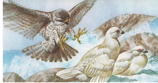
Bata tolonya noldafa nitca ( Laoporus mita ) gan Gyrfalco flaweza su zo onsed. Bantol kan inaf kotocoom al zo orakome aze fioton fu zo bebbuxar. Tolonya nitinda bilika koe Alaska tid calaba vevya ke flaweza : koe Alaska tid vas 89 % ke inafa mulestura ke koe Norpa dice oupon 96 %.

Abrotce : 53 - 60 cm-. Aldo : 0.9 - 2 kg-. Wiltade : 1.20 - 1.35 m-. Bilrugal : 19 tanda koe grolomexo