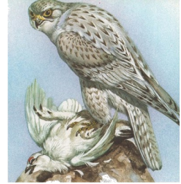
Gyrfalco flaweza va ipomduonum is lofta is krepya is nudol is prokix vovix seabada-duriolom dum tovukol dere malectur.