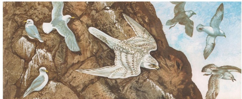
Gyrfalco flaweza va konaka amilafa tsalbarerindin malvayer : orostoron va wivgasi, va asi drumotalar ; oke dum battode, poka kiris laze bargeltafa lofta ( roneon ) begamud, pune va yono jotafa lakro ( talteon ) lasagalayar.